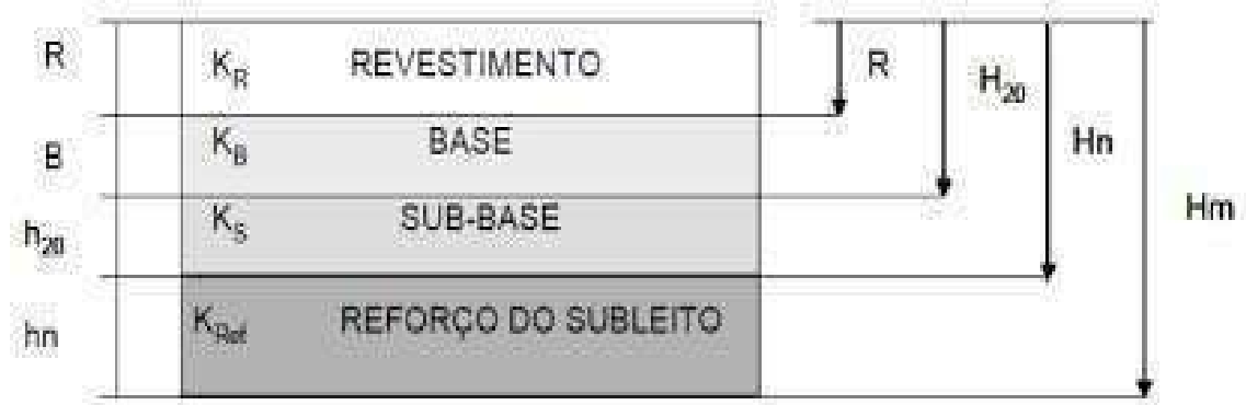
Figura 03. Dimensionamento de pavimento flexível